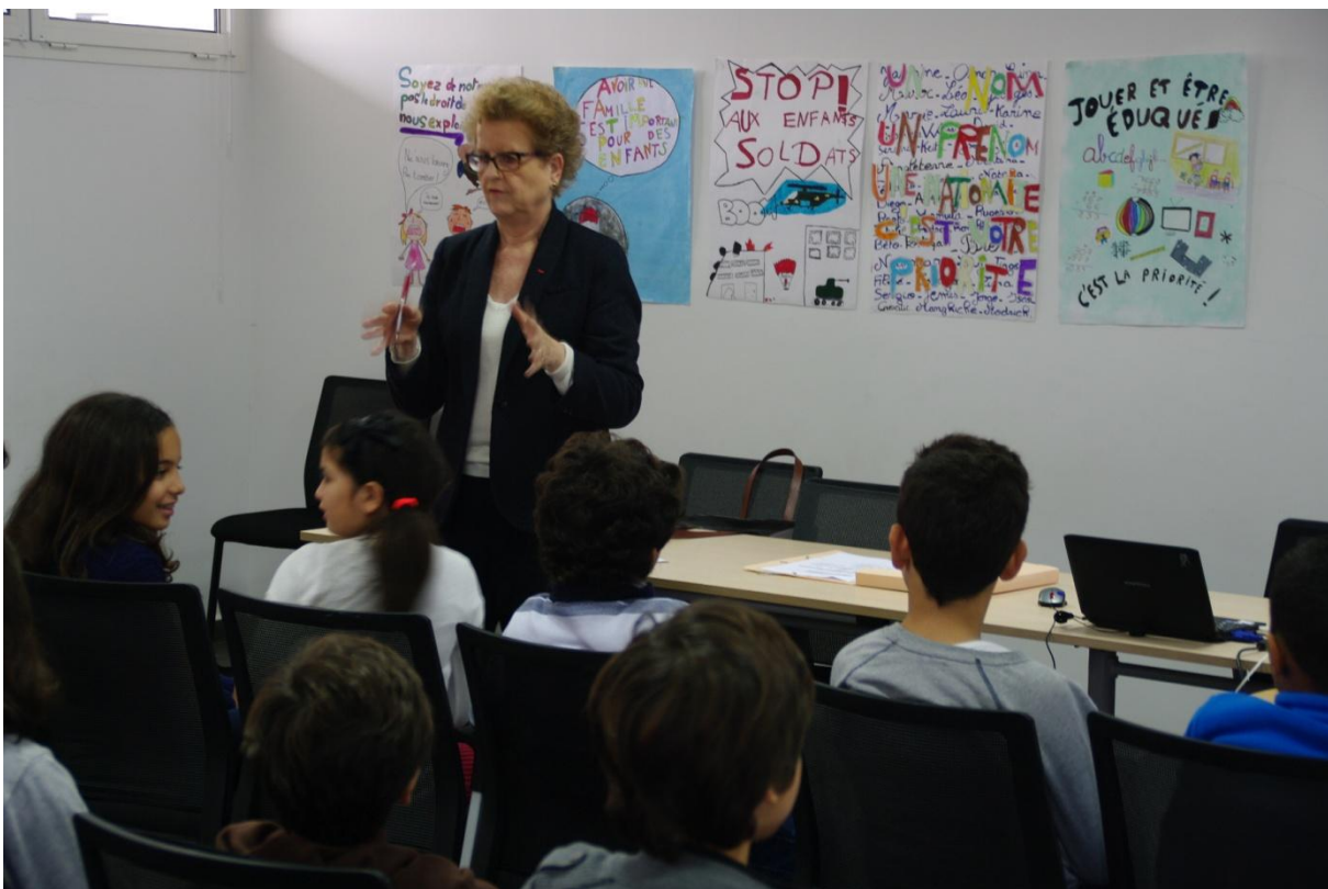
Rencontre avec une classe de CMI