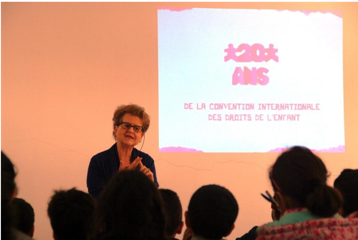
Rencontre avec une classe de CM2

A l'occasion du vingt-cinquième anniversaire de la Convention Internationale des Droits de l'Enfant, le 20 novembre 2014, Madame Claire Brisset s'est rendue, durant trois jours, du lundi 1 er au mercredi 3 décembre 2014, à la rencontre des classes de CM1, CM2 et Sixième.