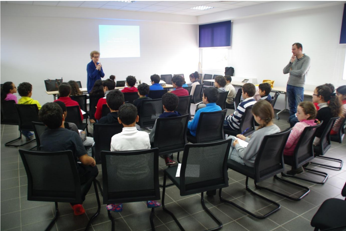
Rencontre avec une classe de CM2