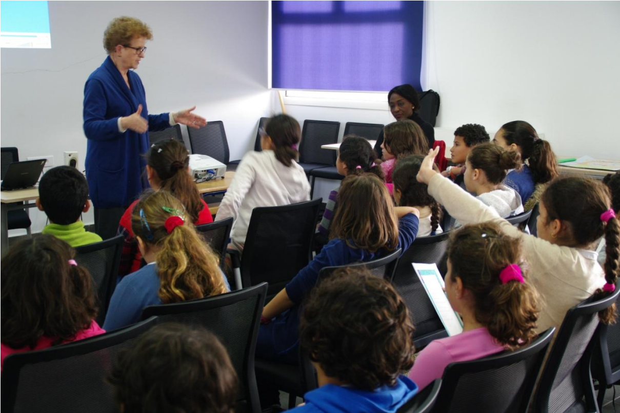
Rencontre avec une classe de CM1