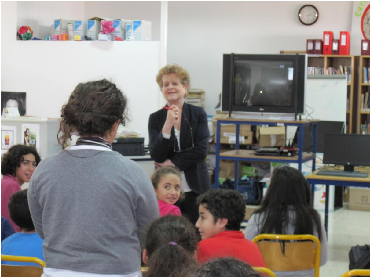
Rencontre avec des classes de Sixième